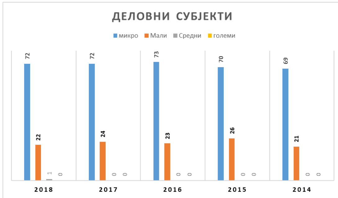
Табела Активни деловни субјекти по сектори според Националната класификација на дејностите Рев.2 во Општина Чашка